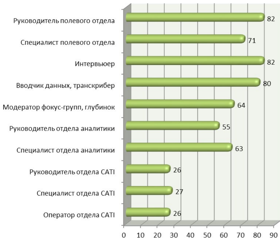
Рисунок 2. Должностная структура российских исследовательских компаний, % должностей в компаниях — участницах исследования

Примерно четверть (23 %) компаний имеют в своей структуре отделы CATI с соответствующей должностной структурой.