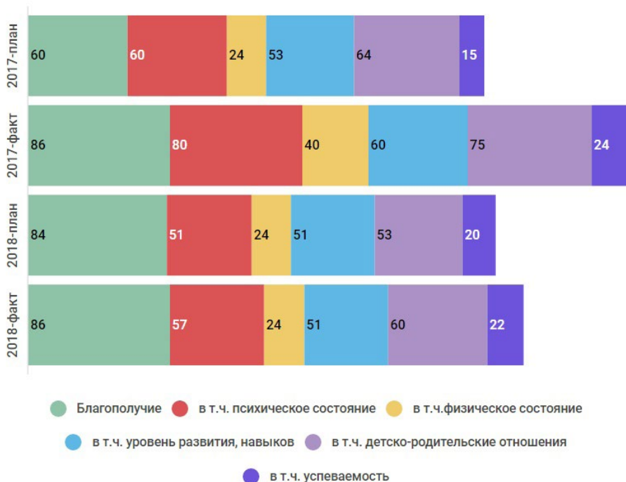
Рис. 1. Динамика использования показателей в практиках организаций-благополучателей конкурса «Семейный фарватер» в 2017—2018 гг. (%) 5