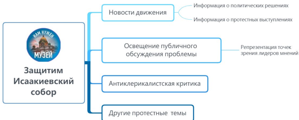
Рисунок 4. Структура повестки сообщества «Защитим Исаакиевский собор»

Непосредственно защите Исаакиевского собора при этом посвящено меньше половины всех постов: на стене сообщества можно увидеть немало публикаций по смежным, а в ряде случаев и откровенно посторонним темам.