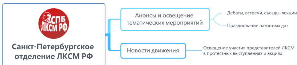
Рисунок 7. Структура повестки сообщества «Санкт-Петербургское отделение ЛКСМ РФ»

Значительная доля постов связана с тематическими мероприятиями: дебаты, встречи, съезды, собрания объединений, таких как марксистский кружок «Тот самый Маркс», «Школа рабочего и профсоюзного движения» и другие.