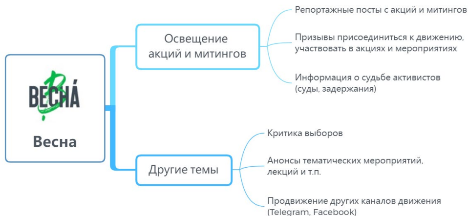
Рисунок 3. Структура повестки сообщества «Движение „Весна“»

В повестке «Весны» присутствуют новости об акциях и митингах, посвященных таким событиям и проблемам, как передача Исаакиевского собора РПЦ, репрессии, годовщина Февральской революции, годовщина теракта в Беслане, трагедия в Кемерово, а также проблемы полицейского насилия, свободы интернета.