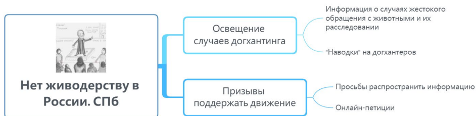
Рисунок 5. Структура повестки сообщества «Нет живодерству в России. СПб» 15

Группа «Нет живодерству в России. СПб» существенно отличается от других рассмотренных сообществ за счет специфической тематики. Подавляющее большинство постов связаны с непосредственной критикой догхантеров, изобилующей резкими эмоциональными выражениями и прямыми оскорблениями конкретных людей. Часто упоминаются фамилии персон, обвиняемых или уже были осужденных за догхантинг, жестокое обращение с животными и сходные преступления.