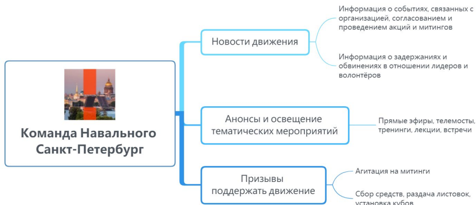
Рисунок 8. Структура повестки сообщества «Команда Навального | Санкт-Петербург»

посылами постов сообщества остаются открытая и адресная критика власти, агитация и призывы поддержать движение.