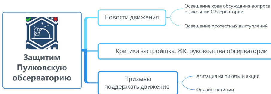
Рисунок 6. Структура повестки сообщества «Сохраним Пулковскую обсерваторию»

В сообществе можно обнаружить посты различной направленности. Прежде всего это новости движения, связанные с судами, акциями и протестными выступлениями, вопросами статуса Главной (Пулковской) астрономической обсерватории РАН.