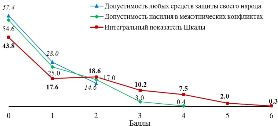
Рис. 2. Распределения значений показателей Шкалы допустимости насилия в решении межнациональных проблем, 2018, %

пока что в России высокой ролью этнонациональной идентичности в их жизни характеризуются одни, а высокой готовностью к применению в межнациональных конфликтах насилия — другие группы населения, что во многом пока смягчает ситуацию в данной сфере.