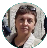
И. И. Юкина

Iukina I. I. (2019) Discussion on Abortions in the Russian Empire: Private Life and New Identity. Monitoring of Public Opinion: Economic and Social Changes . No. 2. P. 243—262. https://doi.org/10.14515/monitoring.2019.2.11 .