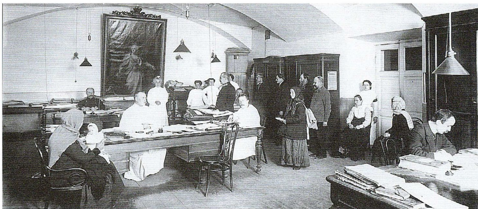
Рисунок 2. Приемный зал Императорского воспитательного дома. Прием прошений от женщин, желающих отдать своих детей. 1913.

Таким образом, более века назад общими усилиями были выработаны основы практически современного понимания репродуктивных прав, которые включают в себя право и доступ к законному и безопасному аборту, право на контрацепцию, право и доступ к информации, необходимой для свободного репродуктивного выбора, право на доступ к медицине в репродуктивной сфере.