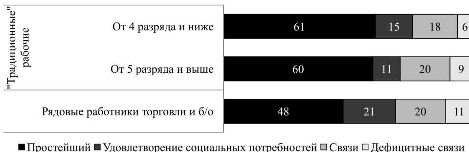
Рисунок 2. Разновидности ресурса сетей представителей некоторых подгрупп рабочих, ИС РАН, 2015 г. % от тех, кто обладает этим ресурсом

Анализ внутригрупповых вариаций показал, что рядовые работники торговли и бытового обслуживания несколько отличаются от «традиционных» рабочих в плане обеспеченности ресурсом сетей — этим ресурсом обладают 68 % из них против 76 % среди высококвалифицированных рабочих и 79 % среди рабочих с 4 разрядом и ниже. Однако, как показано на рис. 2, потенциал социальных сетей рядовых работников торговли и бытового обслуживания по сравнению с «традиционными» рабочими выше, и чаще позволяет не только найти средства на текущее потребление, но и удовлетворить свои социальные потребности. В то же время связи, в том числе и дефицитные, встречаются во всех подгруппах профессионального рабочего класса одинаково редко, особенно по сравнению с руководителями и профессионалами. Кроме того, если учесть меньшую распространенность среди рядовых работников торговли и бытового обслуживания обладания каким бы то ни было ресурсом сетей, то доли обладателей социального капитала в форме, обеспечивающей удовлетворение социальных потребностей или доступ к связям, в абсолютном выражении заметно сближаются. Это свидетельствует о близости представителей «традиционных» рабочих с рядовыми работниками торговли и бытового обслуживания в плане их общей обеспеченности социальным ресурсом.