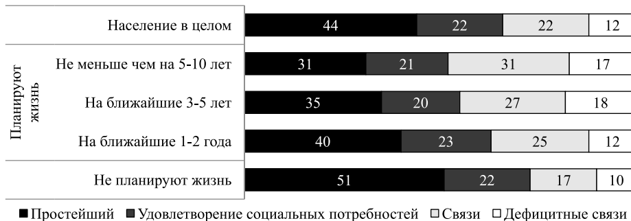
Рисунок 4. Разновидности социального капитала россиян с различным горизонтом планирования, ИС РАН, 2015 г., % от тех, кто обладает ресурсом сетей

напрямую связан с его инвестиционными решениями относительно всех видов его ресурсов. И хотя решения эти принимаются, как правило, бессознательно, роль длительного горизонта планирования для качества социального капитала велика (рис. 4). Факт наличия ресурса сетей также тесно связан с временным горизонтом — достаточно сказать, что среди тех, кто вообще не планирует свою жизнь, каждый третий лишен ресурса сетей в какой бы то ни было форме. Среди тех, кто склонен к долгосрочному планированию жизни (т. е. планирует ее на 5 лет и более) полное отсутствие социального капитала встречается в четыре раза реже.