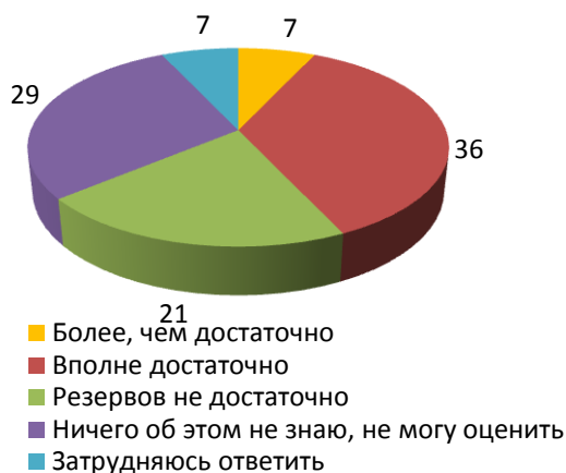
Рисунок 3 - Как Вы полагаете, в целом объемы государственных финансовых резервов России достаточны или недостаточны для оказания помощи населению, регионам, отраслям экономики в различных кризисных ситуациях? (закрытый вопрос, один ответ, в %)