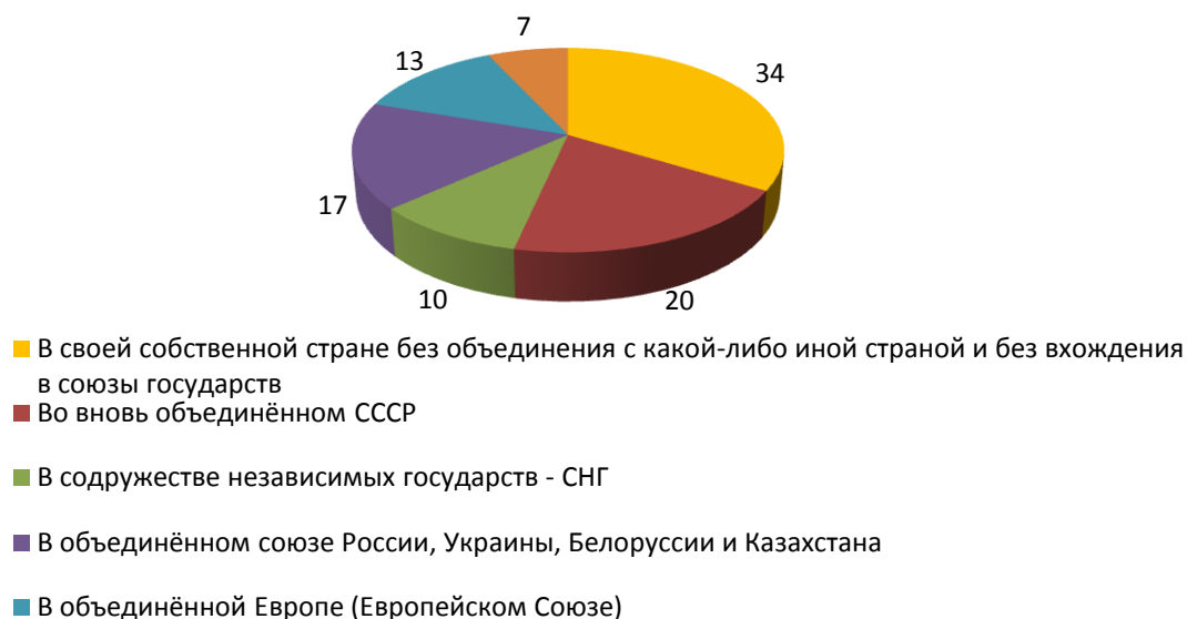
Рисунок 4 - В какой стране или объединении стран Вы хотели бы жить? (закрытый вопрос, один ответ, в %)

над тем, с какими странами следовало бы объединиться России, наши сограждане традиционно выбирают союз с Белоруссией (35%) и Украиной (33%). На третьем месте – Казахстан (27%).