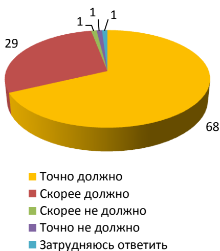
Рисунок 1 - Как Вы считаете, государство должно или не должно обеспечивать население продовольствием, товарами первой необходимости, топливом в случае возникновения различных кризисных ситуаций (военная агрессия, стихийное бедствие, дефицит жизненно необходимых товаров, продуктов питания и пр.)? (закрытый вопрос, один ответ, в %)

Большинство россиян вполне допускают возникновение кризисных ситуаций и в своем регионе, и в стране, однако не делают никаких запасов на случай их возникновения. В то же время, важность государственной помощи населению в подобных ситуациях для россиян очевидна: большинство опрошенных считают, что наличие материальных и финансовых резервов позволяет населению чувствовать себя защищенным, и надеются на помощь государства. Самыми важными запасами считаются медикаменты и продукты питания. Материальные резервы представляются населению в большей степени надежными и оперативными, хотя финансовые ненамного отстают от них по этому критерию. Россияне полагают, что объемы и материальных, и финансовых резервов страны в настоящий момент вполне достаточны.