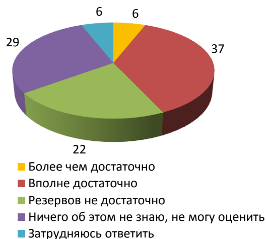
Рисунок 2 - Как Вы полагаете, в целом объемы государственных материальных резервов России достаточны или недостаточны для оказания помощи населению, регионам, отраслям экономики в различных кризисных ситуациях? (закрытый вопрос, один ответ, в %)