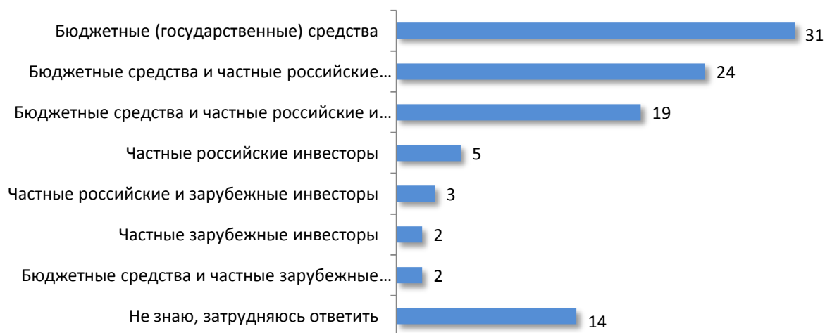
Рисунок 4 - Из каких источников, по Вашему мнению, финансируется строительство олимпийских объектов в городе Сочи? (закрытый вопрос, любое число ответов, в %)

Основными источниками финансирования строительства олимпийских объектов в Сочи россияне считают бюджетные (государственные) средства (так думают 31% опрошенных). 52% россиян считают, что главной компанией-инвестором олимпийского строительства является ОАО «Газпром». Наиболее известные россиянам проекты, реализующиеся на средства инвесторов в рамках Программы олимпийского строительства и развития города Сочи - газификация Черноморского побережья Краснодарского края, газопровод «Джубга – Лазаревское – Сочи» (по 32%), строительство Ледового дворца спорта и Большой ледовой арены – 8% и 7% соответственно. Размышляя о будущем строящихся сейчас олимпийских объектов, россияне чаще всего прогнозируют, что Сочи станет ведущей спортивной базой для подготовки наших спортсменов.