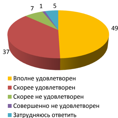
Рисунок 3 - Насколько Вы в настоящее время удовлетворены отношениями в Вашей семье? (закрытый вопрос, один ответ, в %)

Только 8% россиян не удовлетворены своей семейной жизнью. Из всех поговорок о семейной жизни наши сограждане считают наиболее верной пословицу «муж и жена – одна сатана», а вот утверждение «бьет – значит, любит» респонденты считают в корне неправильным – в основном его оспаривают женщины.