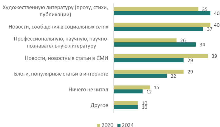
Рис. 1. Что из перечисленного Вы читали за последнюю неделю? (закрытый вопрос, любое число ответов, % от всех опрошенных)

Лидером рейтинга предпочитаемых россиянами жанров в этом году, как и пять лет назад, стали книги исторического содержания (27%). На втором месте — научная и профессиональная литература (24%), а на третьем — классика, как отечественная, так и зарубежная (22%). Почти столько же набирает фантастика, фэнтези