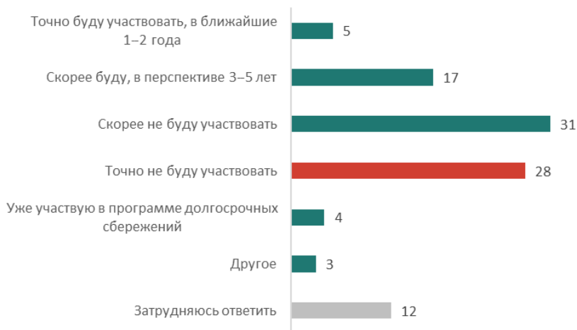
Рис. 3. Лично Вы будете участвовать в программе долгосрочных сбережений или нет? (закрытый вопрос, один ответ, в % от всех опрошенных)

Половина россиян (49%) проявляют интерес к более глубокому изучению программы долгосрочных сбережений, то есть существующий потенциал вовлеченности довольно высокий. Однако почти столько же (47%) не заинтересованы в теме, что указывает на наличие барьеров в восприятии программы. При этом текущие сберегательные привычки не являются ключевым фактором для формирования интереса к программе: среди имеющих сбережения интерес к ПДС проявляют 50%, не имеющих — 47%. Готовность к участию в ПДС декларируют 22%, то есть примерно каждый пятый. Однако о точном намерении участвовать в ПДС в ближайшие один-два года говорят лишь 5%. Большинство же из тех, кто потенциально готов участвовать, откладывают свое решение на более отдаленную перспективу (три-пять лет — 17%), что указывает на недостаточную мотивацию для скорого вовлечения.