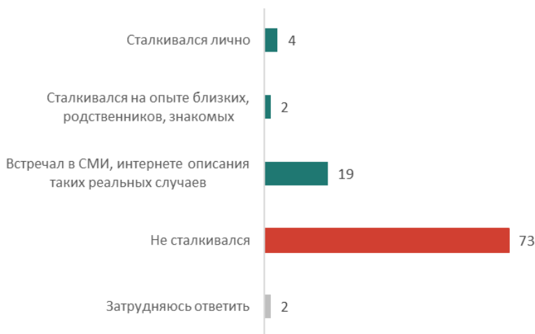
Рис. 2. Скажите, пожалуйста, в течение последнего года Вы сталкивались лично или на опыте близких, родственников, знакомых с эффективным применением искусственного интеллекта в диагностике, лечении заболеваний или встречали в СМИ, интернете описания таких реальных случаев? (закрытый вопрос, до трех ответов, % от всех опрошенных)

вье пациентов от внедрения ИИ в медицине, когда речь заходит о них самих, оптимизм становится сдержаннее. Около половины опрошенных (53%) чувствовали бы себя некомфортно, если бы их врач полагался на ИИ при диагностике и подготовке рекомендаций по лечению. В целом россияне видят потенциал ИИ для улучшения медицины, но, когда дело касается их личного здоровья, они относятся к этому осторожнее. Общество еще не до конца доверяет таким технологиям в медицине и нуждается в дополнительных гарантиях надежности и прозрачности работы ИИ.