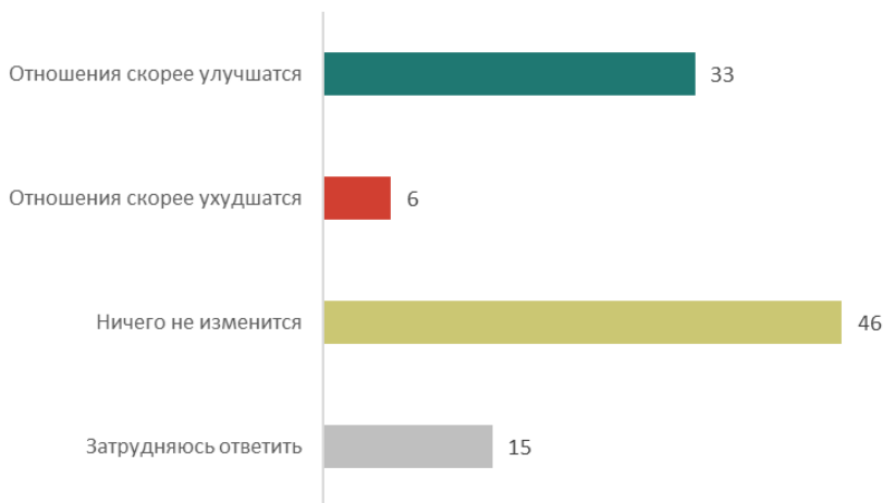
Рис. 2. Как, на Ваш взгляд, отразится избрание президентом США Дональда Трампа на отношениях между Россией и США? (закрытый вопрос, один ответ, в % от всех опрошенных)

Имеющиеся данные позволяют сделать вывод, что Трамп воспринимается как гораздо более дружественный России президент США, чем Обама и, тем более, Байден. В то же время россияне стали заметно более осторожными в своем оптимизме в сравнении с 2016 г., когда на «оттепель» в российско-американских отношениях с приходом Трампа надеялись рекордные 46%.