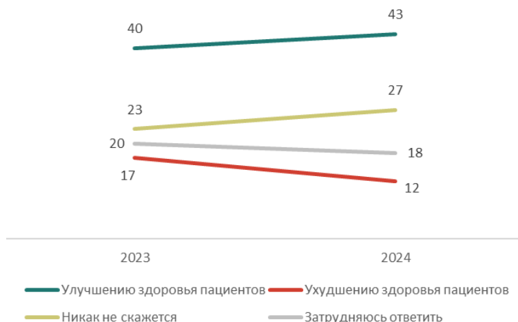
Рис. 1. Как Вы считаете, использование искусственного интеллекта в здравоохранении для диагностики заболеваний и рекомендации лечения приведет к... (закрытый вопрос, один ответ, % от всех опрошенных)

В целом россияне сохраняют позитивные ожидания относительно применения ИИ в медицине, хотя их оптимизм варьируется в зависимости от конкретных аспектов. Четверо из десяти опрошенных (41%) убеждены, что ИИ сократит количество врачебных ошибок, 33% ожидают улучшений относительно безопасности личных медицинских записей. По этим двум вариантам позитивные ожидания преобладают (24—30% считают, что ситуация не изменится, а 17—18% — что ухудшится). Несмотря на то что россияне в целом ожидают положительного влияния на здоро-