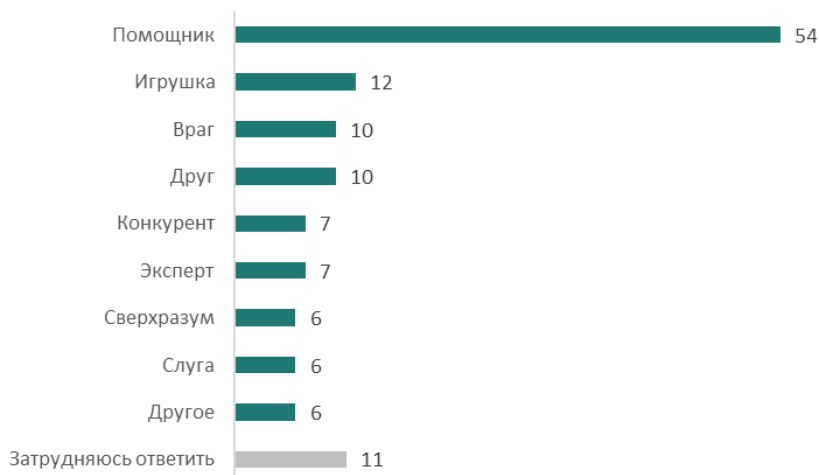
Рис. 2. Лично для Вас искусственный интеллект — это скорее... (закрытый вопрос, до двух ответов, % от всех опрошенных)

В рейтинге источников, к которым россияне готовы обратиться, чтобы разобраться в новом для них вопросе, ИИ занимает последнее место (5 %), уступая даже библиотекам и книгам (6 %). А на первом месте находится интернет (50 %),