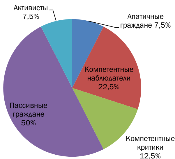
Рисунок 2 - Политические типы личности в РТ

Желание понять, как связаны между собой политическая культура, политический тип личности и политическое участие, в частности электоральная активность граждан, обусловило обращение к достижениям зарубежных ученых в области исследования взаимосвязи политического поведения с уровнем доверия в обществе как базовым компонентом социального капитала.