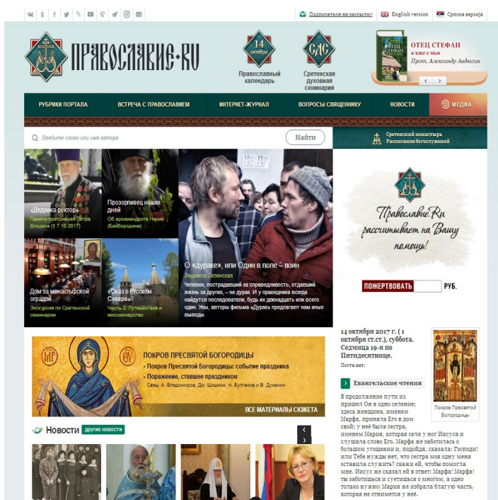
Рисунок 3. Скриншот сайта «Православие.ру»

«Православие.ру» — сайт московского Сретенского монастыря ( http://www.pravoslavie.ru/ ) один из самых посещаемых православных интернет-ресурсов.