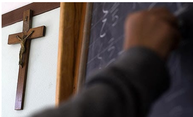
Фотография 7. Распятие в классной комнате Рима 30

Будет уместным рассмотреть и ровно противоположную ситуацию. Когда дело касалось христианских религиозных традиций, ЕСПЧ занял следующую позицию: вопросы присутствия религиозных символов в учебных классах относятся к ведению конкретного государства. Так, в случае с христианской символикой решение ЕСПЧ признавало, что христианское распятие на стенах классов не свидетельствует о нетолерантности к детям, исповедующим другие религии или атеистам 29 .