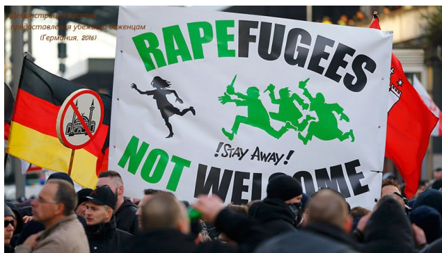
Фотография 2. Демонстрация против предоставления убежища беженцам (Германия, 2016) 6

По официальным данным Федерального статистического управления Федеративной республики Германия 5 , большинство мигрантов в стране имеют турецкое происхождение и исповедуют ислам. Вследствие этого респонденты, разделяющие консервативные ценности, демонстрировали негативное отношение к иммигрантам в целом и к мусульманам в частности [Beirlein et al., 2016].