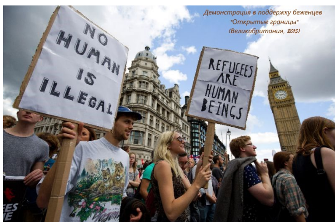
Фотография 1. Демонстрация в поддержку беженцев «Открытые границы» (Великобритания, 2015) 3

Отдельные социологические исследования посвящены рассмотрению ценностных ориентаций как причин негативного отношения к различным группам меньшинств [Feldman, 2003; Schwartz, 1992]. Насколько можно судить по этим работам, позитивное восприятие миграции напрямую коррелирует с принятием на мировоззренческом уровне концепции универсальных общечеловеческих ценностей.