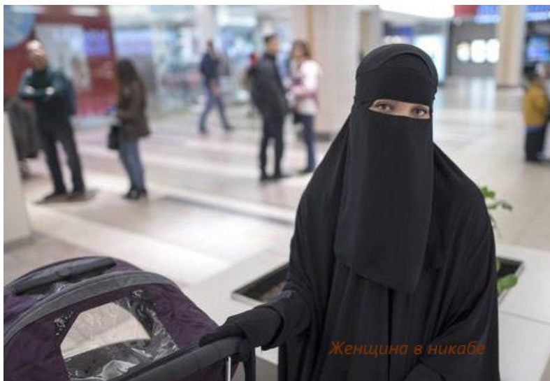
Фотография 6. Женщина в никабе 14

В самой среде мусульманских общин возникают конфликты по причине того, что мусульманские организации руководствуются разными подходами к трактовке вопросов вероисповедания. Приведу пример. Движение светских мусульман 13 выступает за модернизацию ислама и распространение демократических ценностей. Например, активистка движения Фаделя Амара заявляла, что ношение никаба (в переводе с арабского — мусульманский женский головной убор, закрывающий лицо, с узкой прорезью для глаз) означает угнетение женщины.