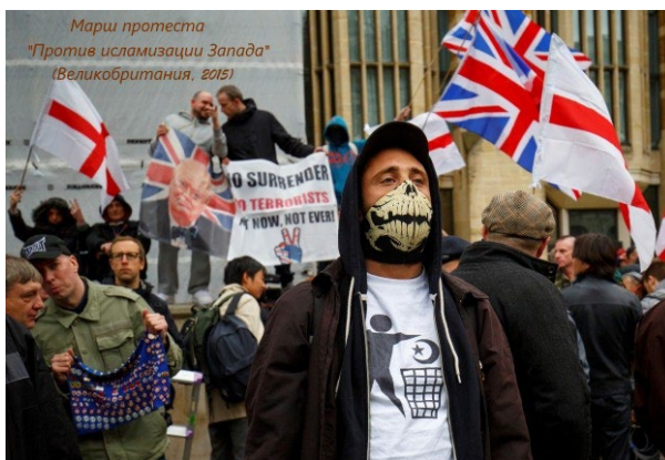
Фотография 3. Марш протеста «Против исламизации Запада» (Великобритания, 2015) 7