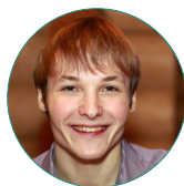
А. В. Тетерин

Teterin A.V. Migrant integration and freedom of religion: modern problems. Monitoring of Public Opinion: Economic and Social Changes . 2018. № 2. P. 194—208. DOI: 10.14515/monitoring.2018.2.11.