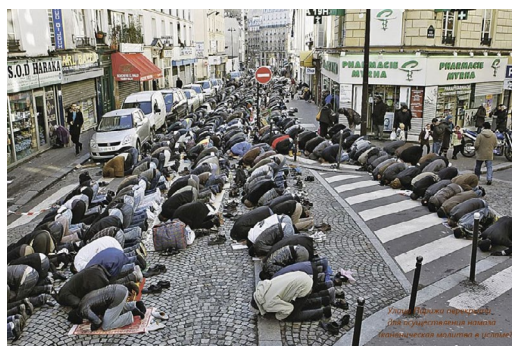
Фотография 5. Улица Парижа перекрыта для осуществления намаза 12

Одно из объяснений, предложенных Конором и Кёнигом, — это различный социальный капитал: мигранты-мусульмане приезжают из стран с неблагоприятными социально-экономическими условиями, имеют низкий уровень образования и не располагают средствами для повышения своей квалификации. Лишь по прошествии законодательно установленного срока для мигранта становится возможным получение гражданства принимающей страны, овладение языком также требует времени. Кроме всего прочего, мусульмане-мигранты уделяют большее время проведению религиозных обрядов, а их ценности, тяготеющие к коллективизму, противоречат европейским [Connor, Koenig, 2015].