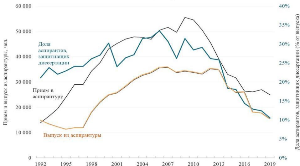
Рис. 1. Основные показатели деятельности аспирантуры в 1992—2019 гг.