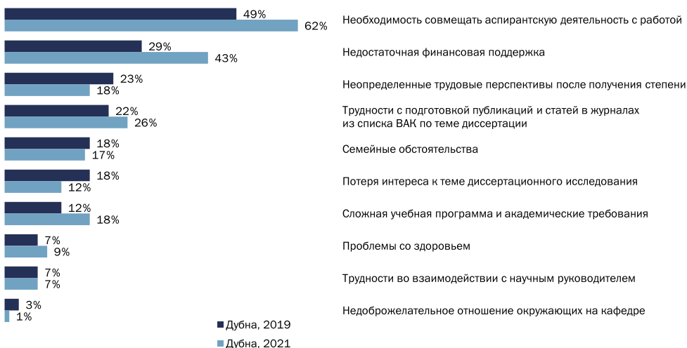
Рис. 3. Факторы, препятствующие успешному обучению в аспирантуре: государственный университет «Дубна» 7

Результаты нашего исследования показывают: трудности во взаимодействии с научным руководителем и недоброжелательное отношение окружающих на кафедре находятся на последнем месте среди всех проблем, с которыми сталкиваются аспиранты университета «Дубна» (см. рис. 3).