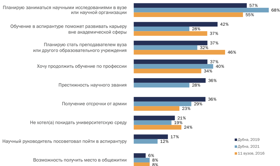
Рис. 2. Мотивы поступления в аспирантуру: сравнение государственного университета «Дубна» (2019, 2021) и 11 российских вузов

В самом конце списка расположилась группа суждений, описывающих случаи недостатка или полного отсутствия мотивации (амотивация в упоминаемой типологии): требование родителей (3,5 % в исследовании 2019 г.), отсутствие перспектив работы по полученной специальности (6 % в исследовании 2019 г.). Значительная доля аспирантов (21 % в 2019 г. и 19 % в 2021 г.) остается в университете из-за нежелания покидать университет, выбирая стратегию «накатанных рельсов». По всей видимости, этот мотив сохраняется на протяжении всего обучения в вузе — 23 % бакалавров университета «Дубна» планируют поступать в магистратуру, поскольку «не хотят покидать университетскую среду» 6 .