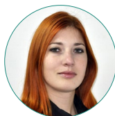
М. П. Кухта

Kuckhta M. P. (2018) Life strategies of different age groups of Ukrainian society in an unstable social situation. Monitoring of Public Opinion: Economic and Social Changes . No. 3. P. 139—160. https://doi.org/10.14515/monitoring.2018.3.09 .