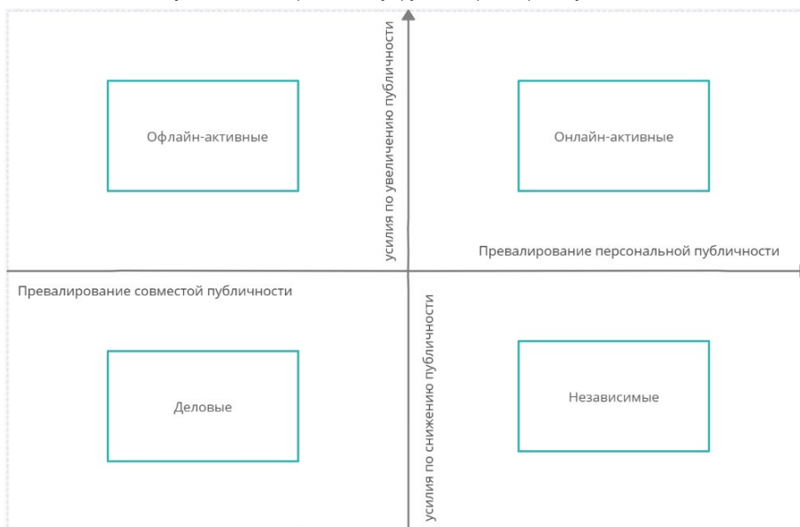
Рисунок 5. Категоризация супруг по параметрам публичности

Пятая стратегия связана с созданием образа, который грубо можно описать как «self-made woman»: мы называем соответствующую группу супруг независимыми ( N = 5, 5,2\% супруг). «Независимые» супруги по всем основным параметрам — наличию работы, бизнеса или НКО — превышают средние значения (в двух случаях из трех более чем в два раза) и, в противоположность «деловым», имеют более высокие значения персональной публичности по сравнению с совместной публичностью. Они довольно часто дают интервью или упоминаются в традиционных СМИ, хотя и используют социальные медиа незначительно чаще, чем в среднем по выборке. Соответственно, в отличие от «деловых» супруг, которые упоминаются скорее в той степени, в какой упоминаются ВДЛ, в данном случае публицистика посвящена непосредственно супругам и их профессиональной или иной деятельности. Супруги в этой группе строили карьеру или развивали бизнес параллельно с карьерным ростом их супруга, то есть в контексте роста значений их персональной публичности играет роль не только замужество с ВДЛ, но и их собственные достижения и заслуги.