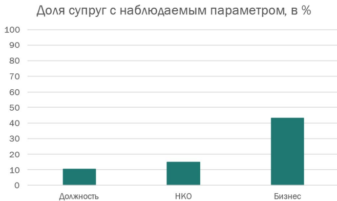
Рисунки 1—3. Описательные статистики по выборке супруг высших должностных лиц субъектов РФ в целом