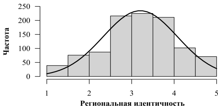
Рис. 2. Распределение частот (гистограмма) для общего показателя по шкале региональной идентичности

Для анализа валидности предложенной версии опросника региональной идентичности был проведен корреляционный анализ, результаты которого представлены в таблице 3. Конвергентную валидность опросника подтверждают корреляции его шкал с показателем региональной идентичности по методике С. Макфарленда: для шкалы идентификации с населением региона и общим показателем региональной идентичности величина корреляций составила не менее 0,70, что свидетельствует о тождественности измеряемых конструктов. Для трех оставшихся шкал, измеряющих идентификацию с культурой, территорией и чувство принадлежности региону, корреляции с региональной идентичностью по методике С. Макфарленда несколько ниже: от 0,49 до 0,64 (все при p < 0,001 ).