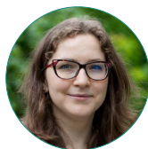
Л. С. Лебедева

Lebedeva L. S. (2018) Quality of life: main approaches and the notion structure. Monitoring of Public Opinion: Economic and Social Changes . No. 4. P. 68—80. https://doi.org/10.14515/monitoring.2018.4.04 .