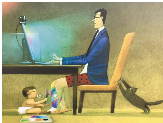
Автор: Андрей Попов

Собственно, взаимодействие лицом к лицу в условиях телесного соприсутствия также всегда было и остается трудным процессом, допускающим возникновение множества осечек и проколов, — когда тактичность «аудитории» (в гофмановском смысле), наблюдающей за чьим-то перформансом (индивидуальным или командным «исполнением»), оберегает участников интеракции от распада разыгрываемого ими и основанного на принципах ситуативной уместности 5 нормированно-фреймированного сценического представления [Гофман, 2000]. Не обязательно сообщать партнеру, что у него «ус отклеилась», можно просто закрыть на это глаза в расчете на то, что он сам исправится (если такие проколы возникают лишь эпизодически, а не регулярно). То же и в дистанте: вовремя не отключенный микрофон, способный предательски выдавать и обнажать наслоения ранее четко физически разделен-