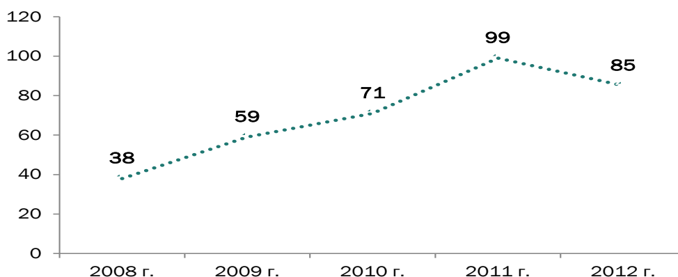
Рисунок 1 — Количество протестных акций Данные: подсчеты авторов.

Протестные акции — одна из распространенных форм публичных мероприятий, которые по уведомлениям занимают около 65% от ее числа. В остальных 35% случаев горожане участвуют в различного рода праздничных (Дни города, молодежи), патриотических (Дни победы), религиозных (крестные ходы), частных (благотворительность) и других акциях. За пятилетний период (2008–2012 гг.) в среднем у обычного тюменца была возможность каждые пять дней видеть протестные мероприятия. Также в течение этого срока он мог бы наблюдать за изменениями в цветах: от абсолютного доминирования коммунистических на небольшие вкрапления анархистских, имперских и других цветов, за которыми стояли новые игроки.