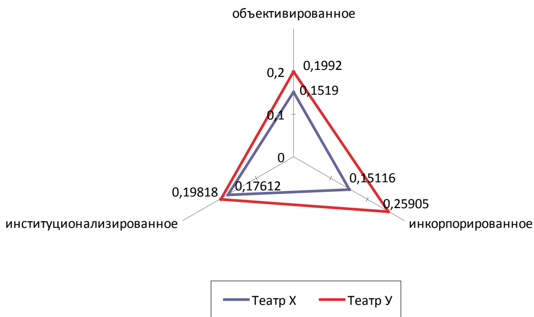
Рисунок 2 — Стандартное отклонение культурного капитала по каждому состоянию

Рисунок 2 отображает распределение стандартного отклонения среднего значения уровня культурного капитала. По всем трем состояниям показатель для Театра У выше, следовательно, можно сделать вывод о том, что в данном театре публика менее однородна, чем в Театре Х.