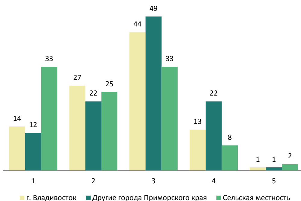
Рисунок 1 — Частотные ряды распределения оценок по возможности организации собственного бизнеса, %

Интерес представляет исследование причин, препятствующих открытию бизнеса на территории различных муниципальных образований. Был задан открытый вопрос: «Какие причины, на ваш взгляд, более всего препятствуют частному предпринимательству на территории вашего муниципального образования?». Таким образом, мы предоставили респонденту полную свободу в своих высказываниях.