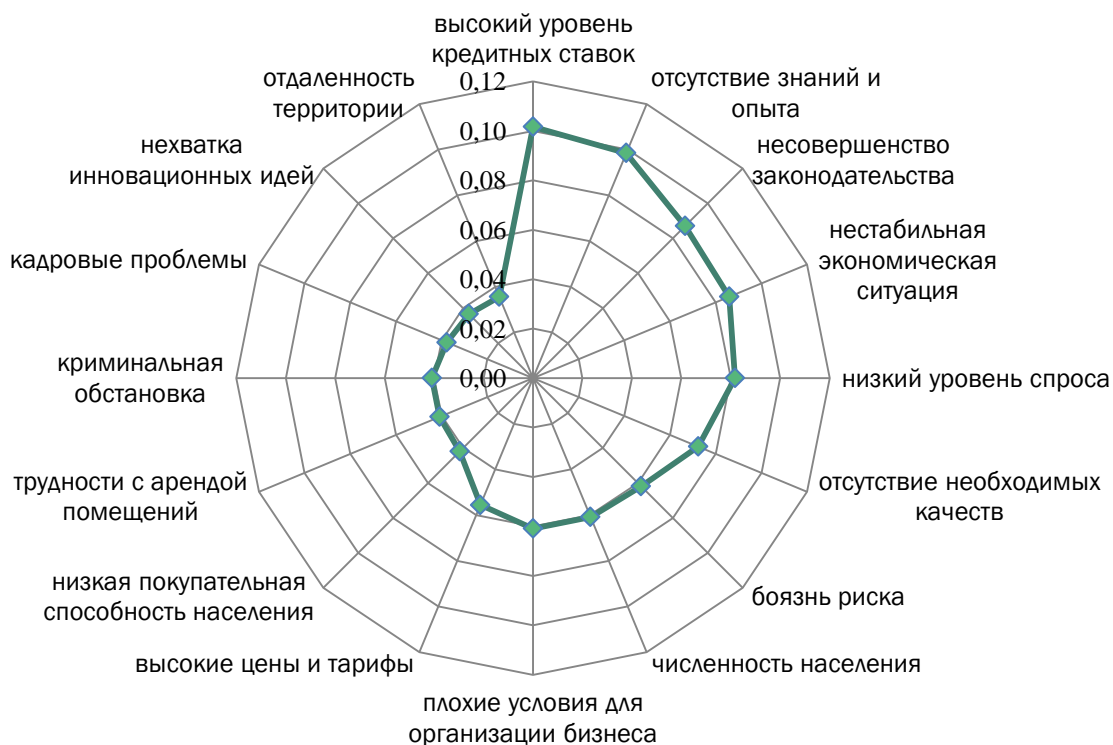
Рисунок 3 — Распределение ответов респондентов по частоте указания причин, препятствующих организации бизнеса (второй класс)

кредитных ставок». Таким образом, подтверждается утверждение о том, что высокие процентные ставки сдерживают деловую активность бизнеса. Обещанные льготы для малого бизнеса на Дальнем Востоке пока не дают положительного результата.