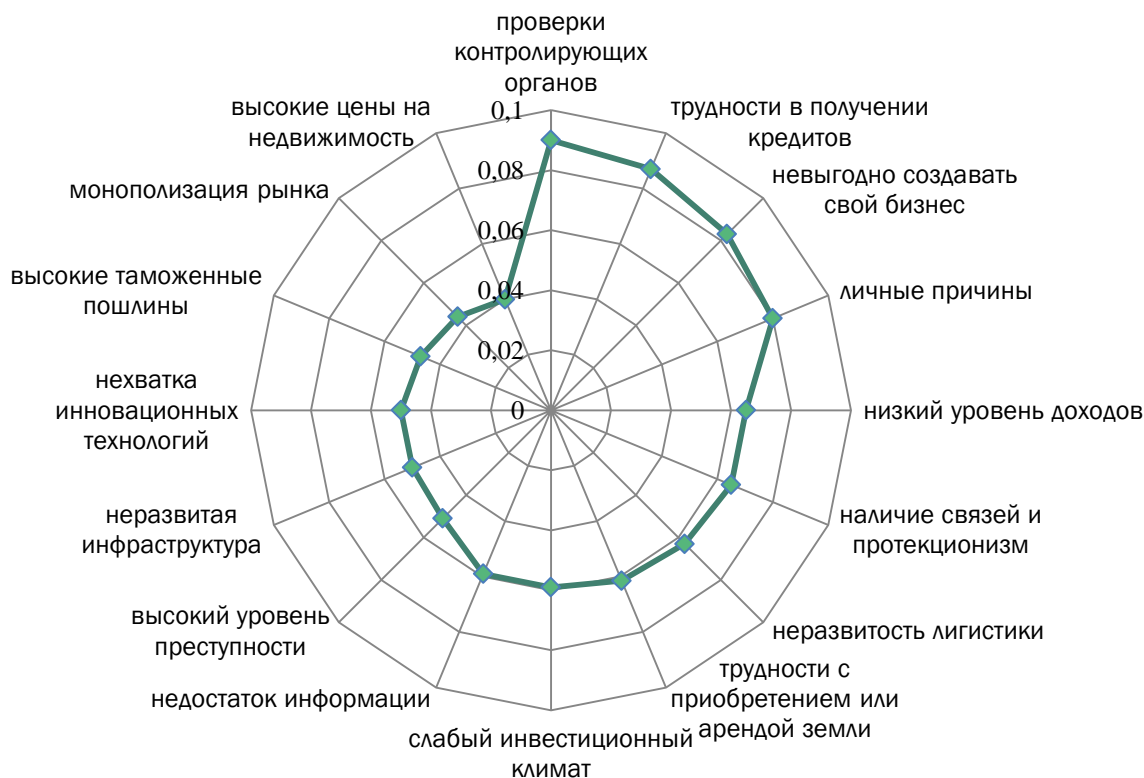
Рисунок 4 – Распределение ответов респондентов по частоте указания причин, препятствующих организации бизнеса (третий класс)

На данном этапе мы считаем проблему структурирования данных важнейшей.