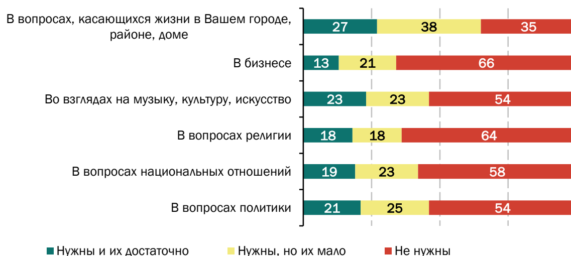
Рисунок 2 - Мнение россиян о том, нужны ли им единомышленники — люди, разделяющие их интересы, принципы, жизненные цели в различных вопросах, % (один ответ по каждой позиции)

Местные проблемы также являются для россиян значимым интегративным и коммуникационным фактором (см. рис. 2). 65% опрошенных заявили, что в вопросах, касающихся жизни в их городе, районе или доме, им нужны единомышленники, разделяющие одинаковые с ними интересы, принципы и жизненные цели. Это больше, чем в вопросах музыки, культуры, искусства (47%), политики (46%), национальных отношений (42%), религии (36%) и бизнеса (34%). Из этих 65%, почти половина (38%) респондентов признались, что таких единомышленников у них недостаточно.