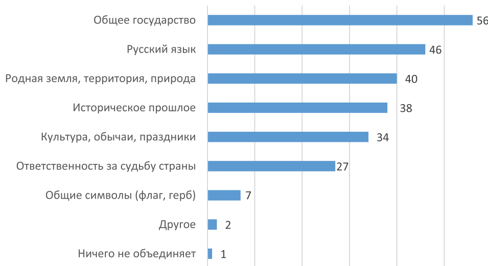
Рис. 1. Консолидирующие индикаторы в российской идентичности, в % от опрошенных

В количественном опросе у нас не было возможности спросить, что люди имеют в виду, называя категорию «общее государство» объединяющим фактором. В интервью с экспертами присутствовал такой нарратив: